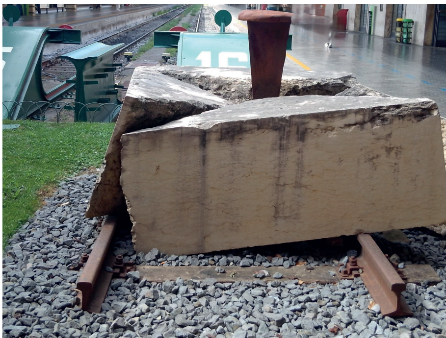
Firenze binario 16 "Monumento alla memoria dei deportati fiorentini" di Nicola Rossini

Dopo l'8 settembre 1943, durante l'occupazione tedesca su un totale di 9000 ebrei italiani deportati o uccisi, più di 500 erano di Firenze 126 . Di coloro che furono deportati nei campi di sterminio quasi tutti non tornarono. I nazisti profanarono la Sinagoga e piazzarono mine all'entrata che fortunatamente arrecarono solo limitati danni alle strutture. Dopo la guerra, la scuola ebraica è stata riaperta e il Tempio è stato restaurato 127 .