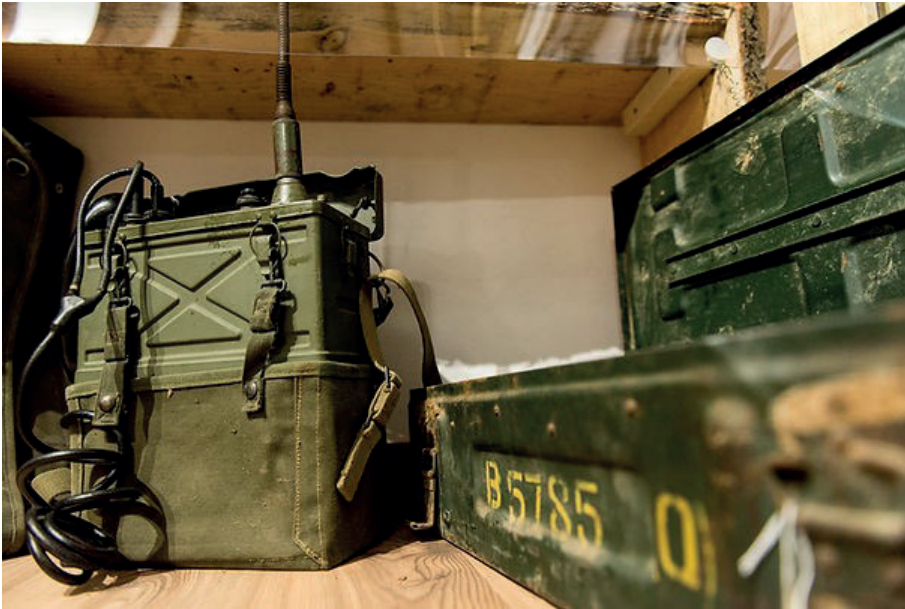
Museo Linea Gotica Pianosinatico – stanza americana

Mussolini non dette peso a questo avvertimento ma nemmeno seguì il consiglio del Capo di Stato Maggiore, generale Ambrosio, che gli aveva chiesto di uscire dal conflitto quanto prima.