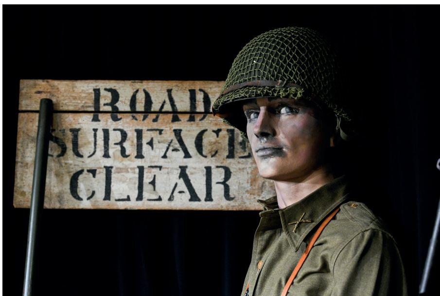
MuGot Museo Gotica Toscana Ponzalla

All'inizio di novembre, la flotta americana in navigazione nell'Atlantico fu avvistata dai tedeschi. Ma non sapevano dove si stava dirigendo. Luigi Ceva ha riportato l'intercettazione di una conversazione telefonica fra Göring e Kesselring 145 nella quale ipotizzavano che l'obiettivo fosse la Sardegna o la Corsica o qualche porto dell'Africa. "Non comunque nell'Africa francese" aveva concluso Göring. Probabilmente pensava che gli Stati Uniti, che non erano in guerra con la Francia di Vichy, non avrebbero voluto attaccare un territorio controllato appunto dal governo di Pétain.