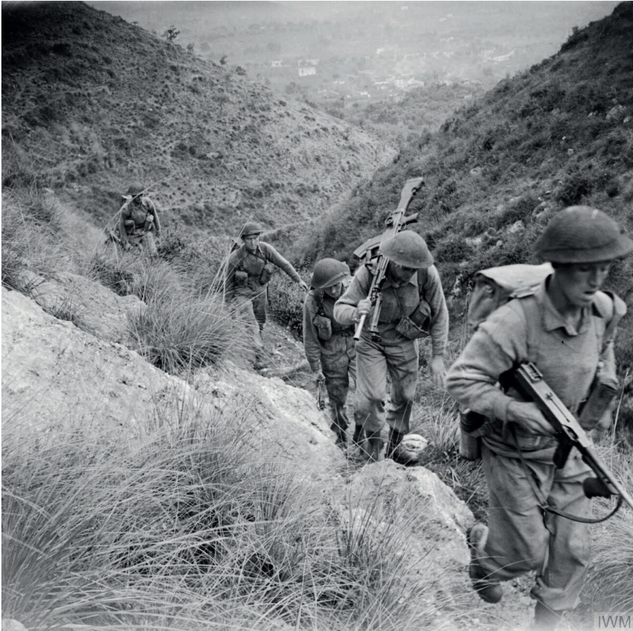
Soldati britannici risalgono la Penisola

Proprio per la configurazione del terreno e per le salde fortificazioni, questo caposaldo ritardò per diverso tempo l'avanzata degli Alleati e fu teatro di cruente battaglie. Quando avvenne lo sfondamento, il 18 maggio 1944, i tedeschi arretrarono su altre due linee la Hitler e la Caesar poste circa una ventina di chilometri una dall'altra.