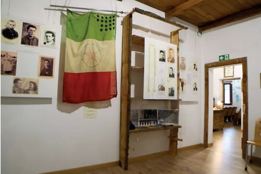
Museo Lina Gotica Pianosinatico Mostra Brigata Partigiana Bozzi

storico M.M La Marina italiana nella 2° guerra mondiale vol XV parte 2 dall'8 settembre alla fine del conflitto 3) Stato Maggiore Aeronautica – Ufficio storico A.M. L'aeronautica italiana nella guerra di liberazione 1943-45 Roma 1961