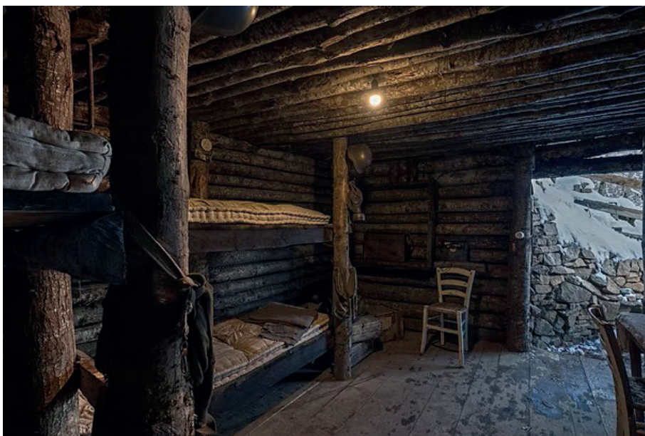
Museo Linea Gotica Pianosinatico interno di un bunker

Sulla linea Gotica la Wermacht schierò 19 divisioni, però numericamente incomplete, tante quante ne avevano gli attaccanti. Era invece assai forte il divario delle forze aeree. Dopo aver attraversato l'Arno, gli Alleati erano arrivati alle pendici del' Appennino tosco-emiliano ma era ormai tardi per tentare lo sfondamento prima dell'inverno.