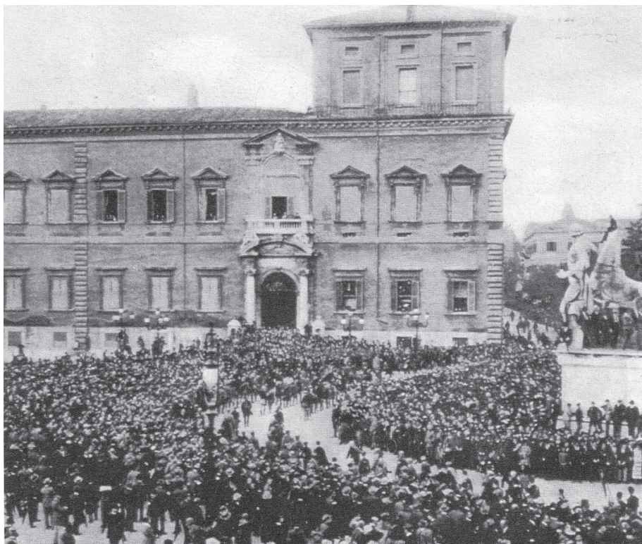
Sfilata dopo la marcia su Roma

Lussu ricorda che a Milano il Prefetto convocò Mussolini il quale si presentò “remissivo” e tutti si attendevano il suo arresto ma alle 12,40 arrivò la notizia della revoca dello stato d’assedio 44 . A questo punto si capì che il capo fascista aveva vinto la partita. Infatti, dopo un tentativo con Salandra, che non avendo ottenuto l’appoggio dei fascisti, rinunciò, giunse il telegramma che convocava a Roma Mussolini per formare il Governo.