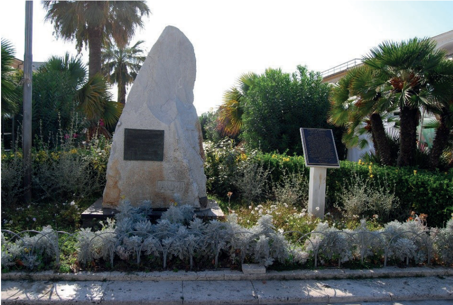
Viareggio Stele commemorativa dell'Amm. Inigo Campioni nella Piazza omonima

E voglio ricordare l'ammiraglio viareggino Inigo Campioni insieme al genovese Luigi Mascherpa.