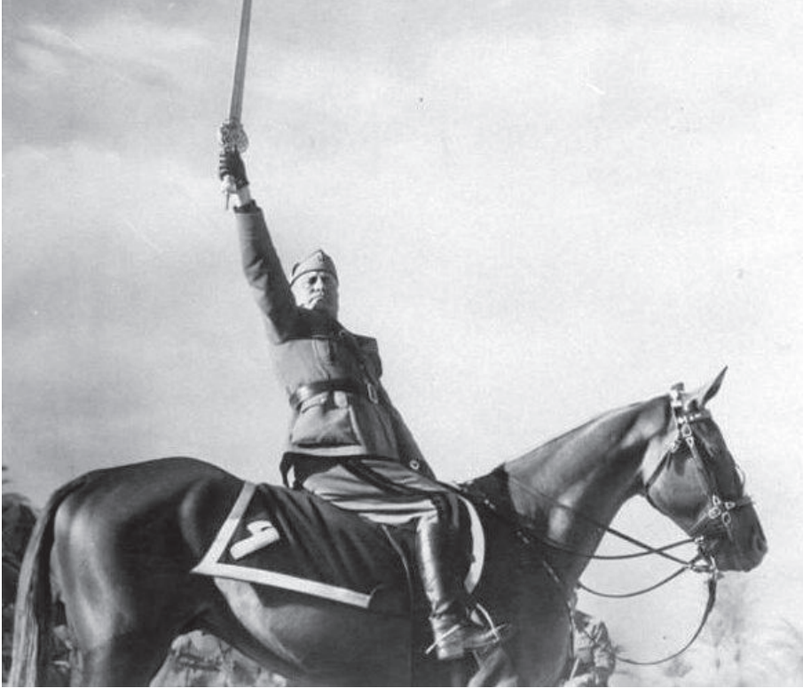
Mussolini in Libia

Il 10 giugno 1940, Mussolini, galvanizzato (e anche ingelosito) dal successo dell'alleato tedesco che aveva annientato l'esercito francese e si apprestava a innalzare la croce uncinata sulla torre Eiffel, annunciò dal balcone di Palazzo Venezia l'entrata in guerra dell'Italia 104 . Sapeva che il nostro Paese era militarmente ed economicamente debole 105 , ma riteneva