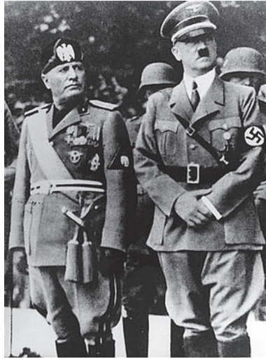
Hitler e Mussolini a Monaco nel 1937. Siamo ormai nel baratro

Il decreto dell'incendio del Reichstag e i pieni poteri ma soprattutto il modo con cui vennero attuati, configurano un vero e proprio colpo di stato. A quel punto, non si può nemmeno parlare della remissività dei tedeschi di fronte all'autorità. Perché chiunque avesse osato fare ricorso contro il carattere anticostituzionale di tali provvedimenti o anche solo protestare, sarebbe stato arrestato e spedito in un lager. E la cosa sarebbe finita lì. Caso mai era qualche tempo prima che l'opinione pubblica avrebbe dovuto insorgere contro le prepotenze e le intimidazioni delle squadre naziste.