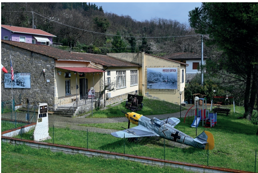
MuGot Museo Gotica Toscana Scarperia

Il 28 ottobre 1940 Hitler arrivò a Firenze per un nuovo incontro con Mussolini. Appena scese dal treno nella Stazione di S.M. Novella il dittatore italiano gli comunicò, con compiacimento, che da qualche ora le sue truppe avevano attaccato la Grecia. Il Führer nazista, che ne era già informato, apparve visibilmente contrariato, tanto che l'incontro fu di breve durata. Più volte Hitler si era detto contrario a un impegno bellico nei Balcani, dai quali importava materie prime preziose, a cominciare dal petrolio. Inoltre, temeva che questo nuovo sforzo bellico dell'Italia diminuisse quello in Africa e impedisse di marciare verso l'Egitto e il canale di Suez.