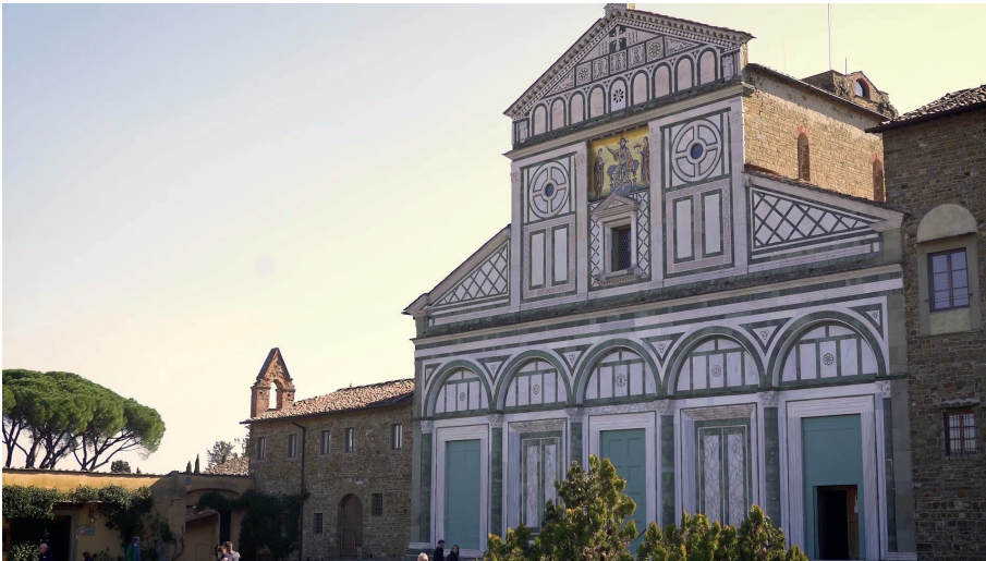
Basilica di S. Miniato al Monte. Da Firenze un messaggio di pace

Ma questi due eventi-simbolo dettero slancio agli alleati e a gli uomini della Resistenza e proprio perché caratterizzati dall'insurrezione popolare, furono in entrambi i casi il segnale che per i nazifascisti il tempo era definitivamente scaduto.