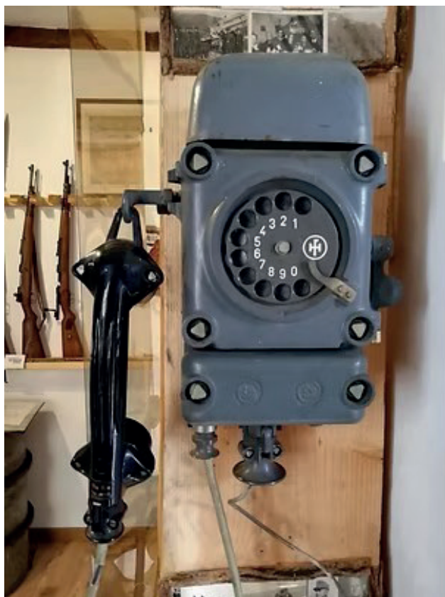
Museo Linea Gotica Pianosinatico Telefono antiesplorazione nel Bunker

veloce penetrazione di forze corazzate 196 .