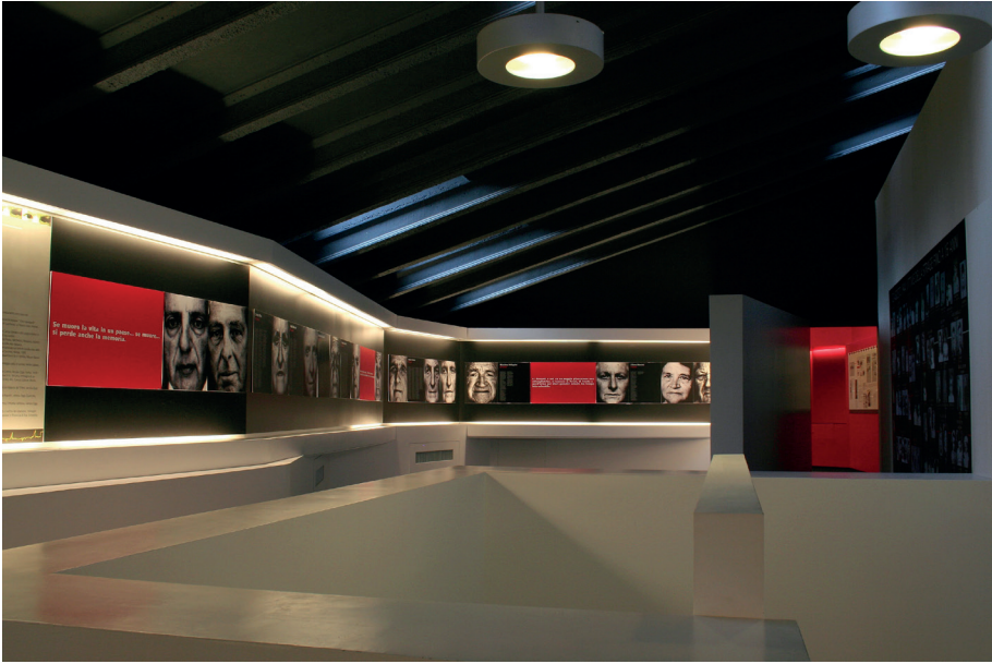
Museo storico della Resistenza a S Anna di Stazzema