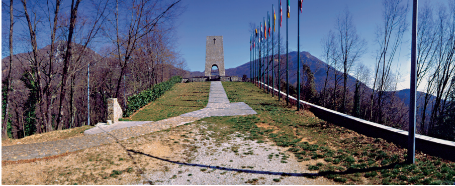
Foto n. 1 bis Firenze: nella sua storia messaggi di libertà, democrazia, pace

Adesso che il dolore era diventato piu' forte di me, sentivo perfino con orrore quanto grande fosse la vita. Sentivo che quel dolore era come un sacrificio, ed e' per questo, capite, che ogni religione, ha messo la sofferenza sull'altare di Dio". Karel Čapek