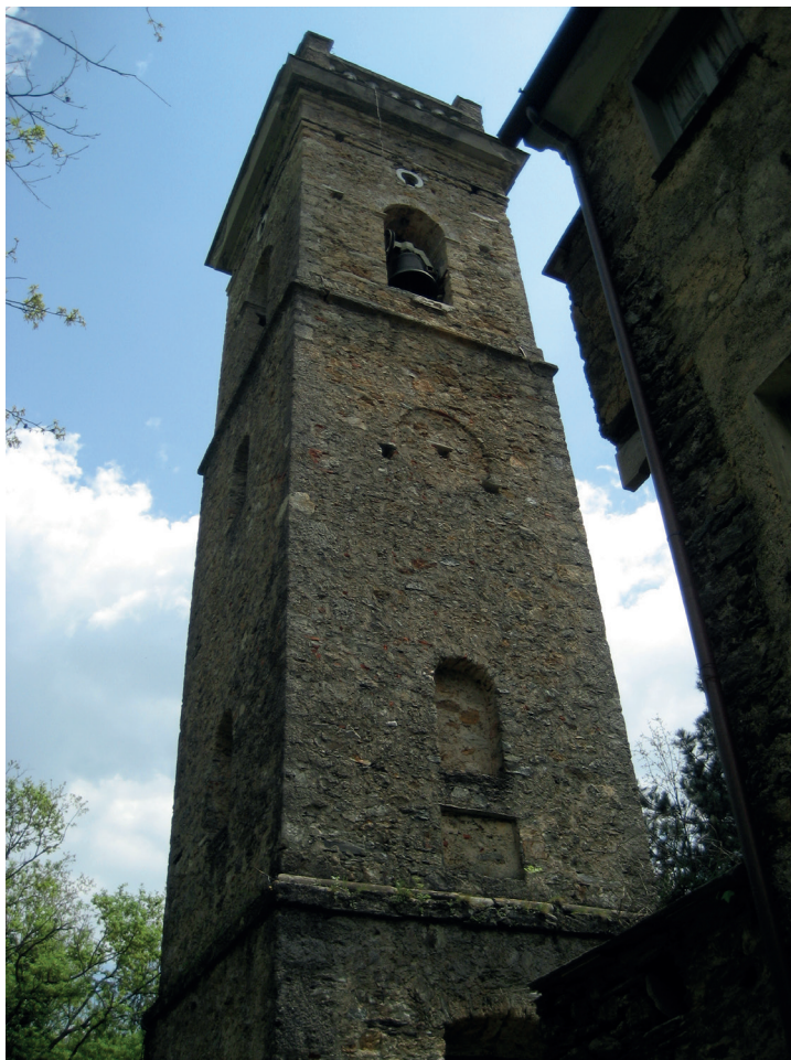
Torre Campanile di S.Amma do Stazzema

Bologna. Scesero in campo quattro divisioni ma i tedeschi si batterono con tale ostinazione che per tre settimane gli statunitensi non riuscirono ad avanzare, in media, per più di 1,5 chilometri al giorno, 199 fino a che i reparti della Wermacht non furono costretti a ritirarsi sugli ultimi rilievi prima di Bologna. Tra il 16 e il 20 ottobre la 5 a armata compì un ultimo balzo arrivando a pochi chilometri dalla via Emilia, ma i tedeschi difesero strenuamente questa arteria per loro così indispensabile 200 e il Po era ancora a 80 km di distanza.