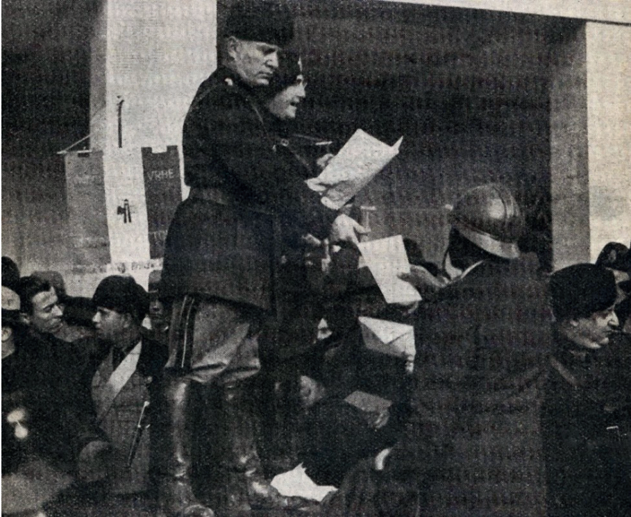
Mussolini negli anni '30

(in occasione dell'annessione di Fiume all'Italia) su proposta del Capo del governo gli fu conferito il titolo di Principe di Montenevoso. Si è detto che il perpetuo bisogno di denaro spinse d'Annunzio ad accettare i vantaggi che il Duce gli elargiva come i fondi per l'imponente ristrutturazione del Vittoriale 59 . Ma probabilmente il vero motivo era che il Poeta si sentiva ormai stanco e privo di prospettive. Era ben diverso dall'uomo che pochi anni prima aveva occupato Fiume. Il suo esilio dorato era il segno che si accontentava ormai della rievocazione della gloria passata.