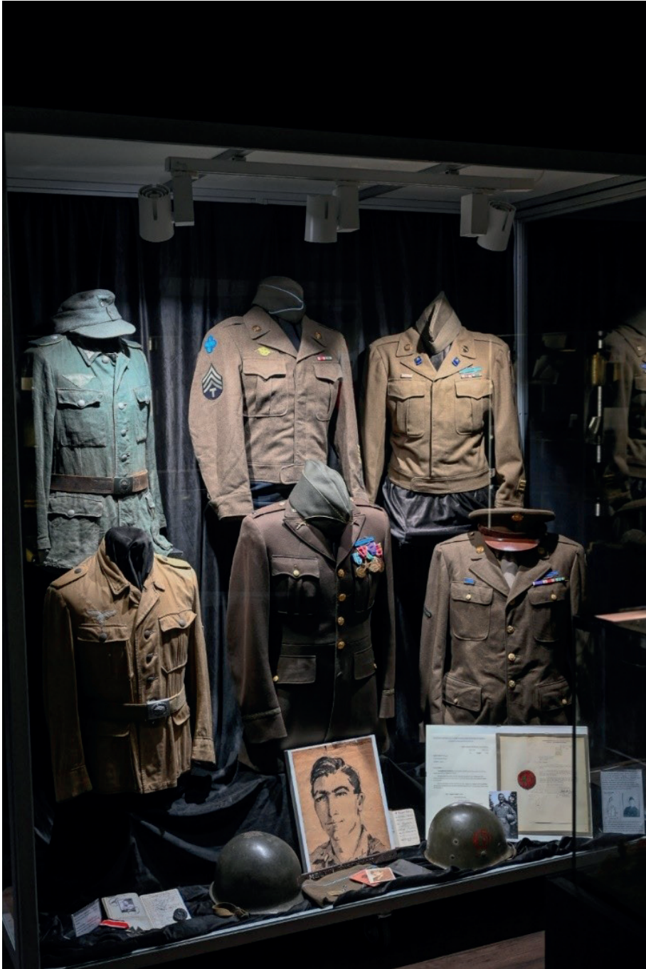
MuGot Museo Gotica Toscana Ponzalla