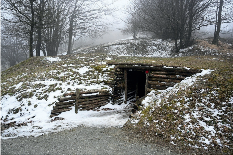
Bunker - MuGot Museo Gotica Toscana Ponzalla

D'altronde, si riteneva arduo arrivare al Po prima dell'inverno perché c'erano ancora numerosi fiumi e torrenti da oltrepassare e il terreno costiero nell'area di Comacchio era notoriamente paludoso, quindi inadatto ai mezzi pesanti, mentre le unità di fanteria avevano subito perdite troppo ingenti.