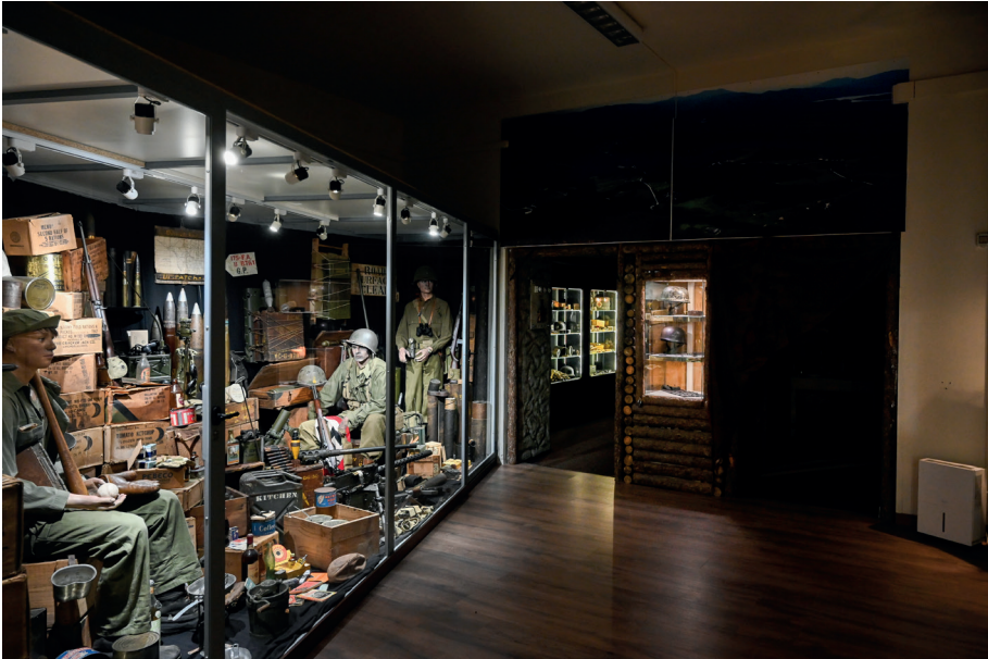
MuGot Museo Gotico Toscana Ponzalla

prevenire un'analoga mossa americana. Inoltre, si ritiene che avesse sottovalutato il potenziale bellico e industriale statunitense. Ma è plausibile anche che in un delirio di onnipotenza volesse arrivare allo showdown e ritenesse che il momento migliore fosse proprio quello in cui gli USA erano indeboliti dalla guerra nel Pacifico. Tanto più che, in questo modo, il Giappone avrebbe potuto demolire l'Impero britannico in Asia e Londra avrebbe dovuto fare a meno delle truppe australiane 144 .