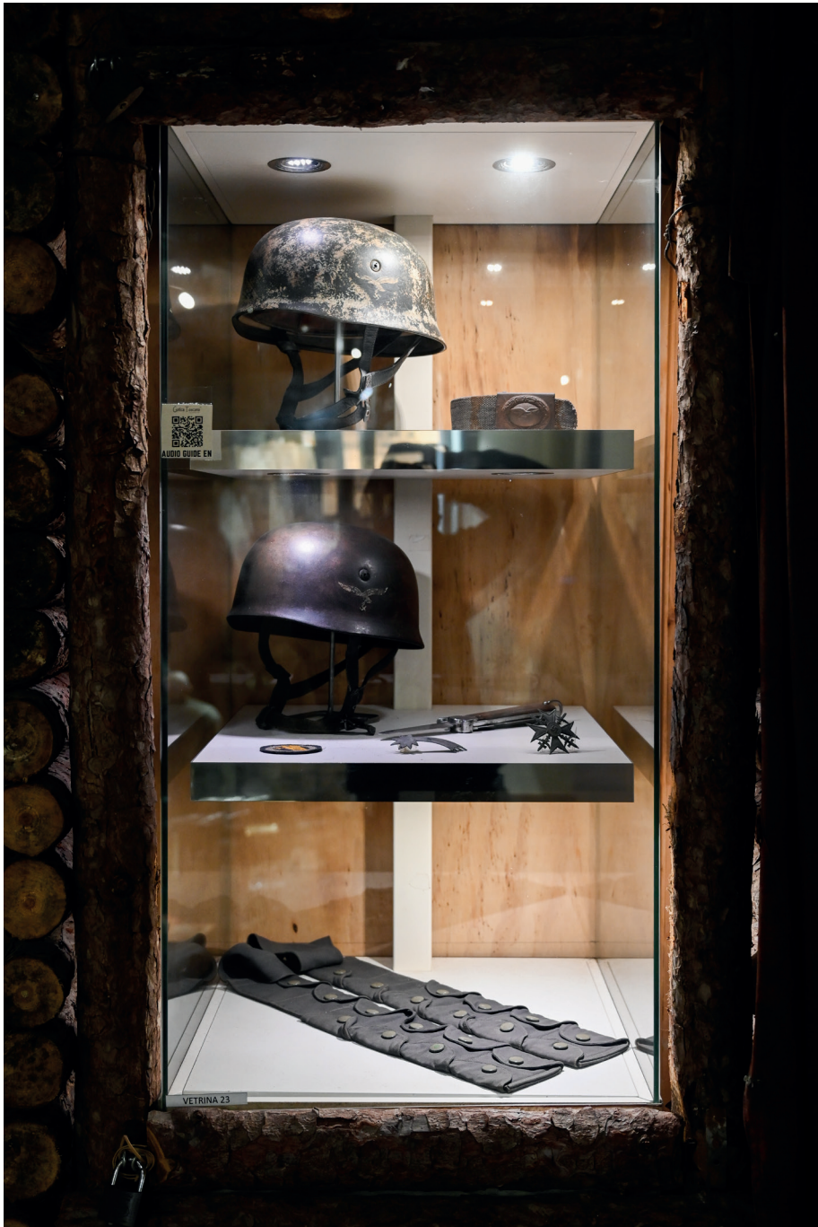
MuGot Museo Gotica Toscana Ponzalla