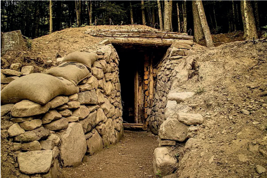
Esterno di un Bunker Museo Linea Gotica Pianosinatico

E' stato detto che Roosevelt voleva evitare che le armate angloamericane entrassero nel bacino del Danubio per non contrariare Stalin. Ma vari storici ritengono che la ragione di Anvil non fosse questa, bensì rappresentasse un'opzione strategica del generale Marshall alla quale abbiamo già accennato: riunire le truppe sbarcate in Provenza con quelle che stavano avanzando dalla Normandia, in modo da operare quella "convergenza degli sforzi bellici" che era tipica della dottrina militare statunitense 185 .