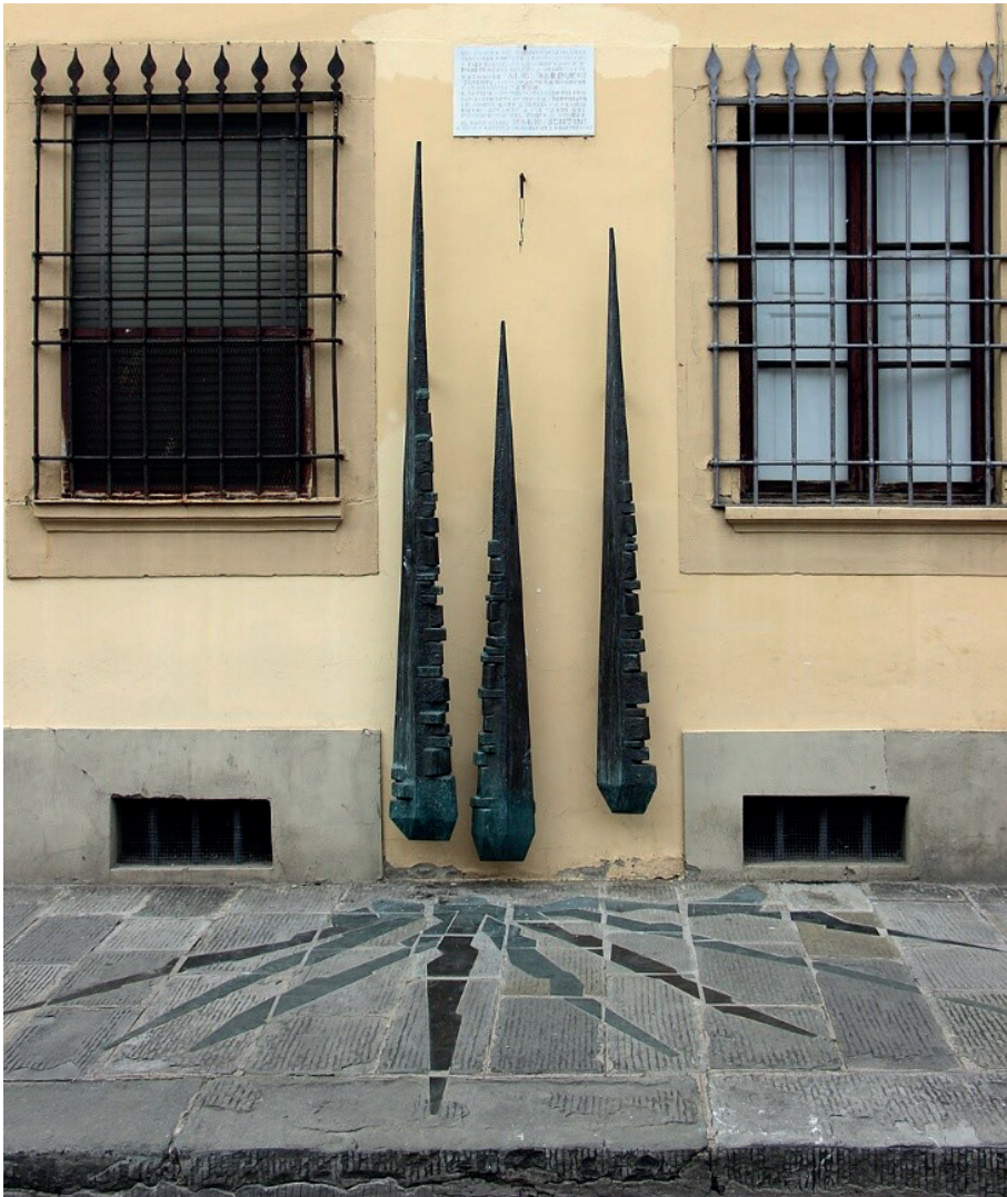
Monumento ai Partigiani caduti Firenze Oltrarno

Il prof. Barbero 177 nel rilevare che i Comandi tedeschi sarebbero riusciti ad avvantaggiarsi parecchio se avessero avuto a disposizione, non sette, ma anche solo una divisione in più, ha portato un esempio illuminante: nella circostanza dello sbarco alleato nella Francia meridionale, il 15 agosto 1944, il maresciallo Kesselring decise di inviare immediatamente