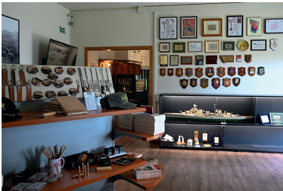
MuGot Museo Gotica Toscana - Ponzalla

Arrivarono in Turingia e il 10 aprile liberarono i prigionieri del campo di Buchenwald mentre i sovietici il 13 aprile sarebbero entrati a Vienna e da lì avrebbero iniziato l'offensiva finale per Berlino che raggiunsero il 20 aprile.