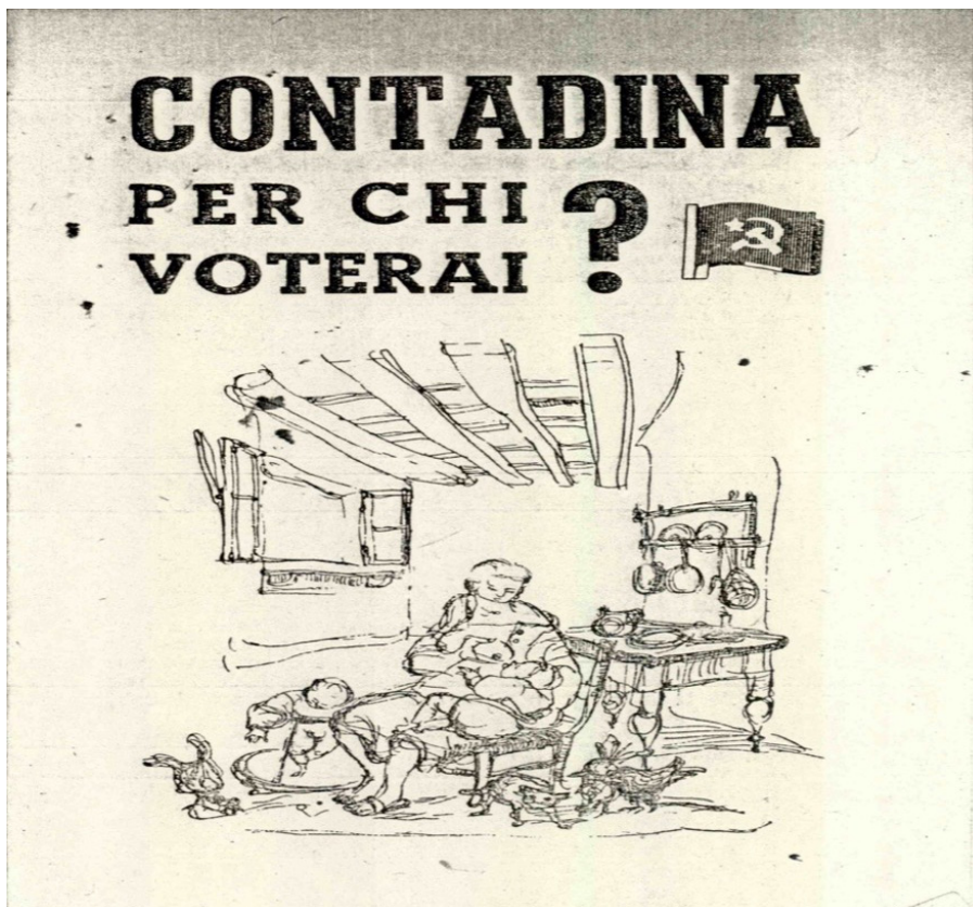
Asa, Prefettura, Fascicolo 122, Partito Comunista, 1946

Come strumento per la campagna elettorale il Pci, spesso oltre ai cartelloni, utilizzava la bandiera rossa che riportava il simbolo di falce e martello; nelle campagne veniva issata in cima alle aie e stava a rappresentare la presenza del partito nella zona e la conquista effettuata. Non dobbiamo dimenticare neppure congressi e comizi.