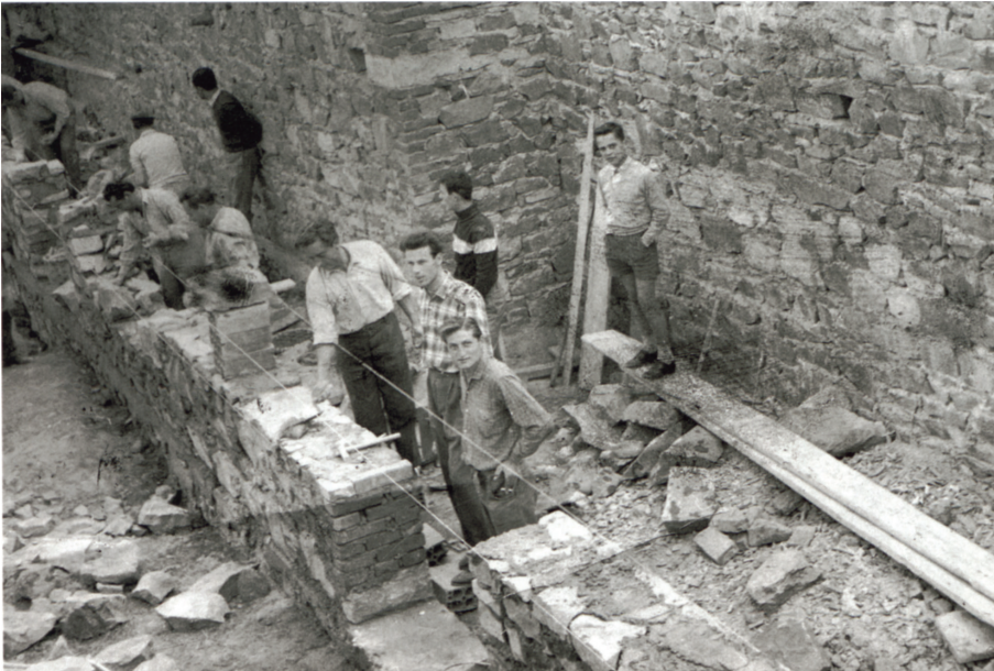
I volontari costruiscono la Casa del Popolo di Reggello, inaugurata nel 1960

Molti conoscono la mia storia ma non tutti i giovani sanno che sono stato un fondatore della Casa del Popolo e il primo presidente, eletto con l'incarico di assistere all'organizzazione dei lavori dal principio alla fine della sua costruzione, e così feci.