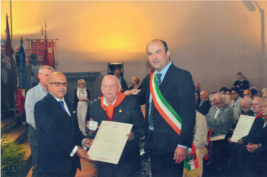
Salone 500 per conferimento Medaglia della Liberazione del Ministero degli Interni con Sua Eccellenza il Prefetto di Firenze e del Sindaco di Reggello