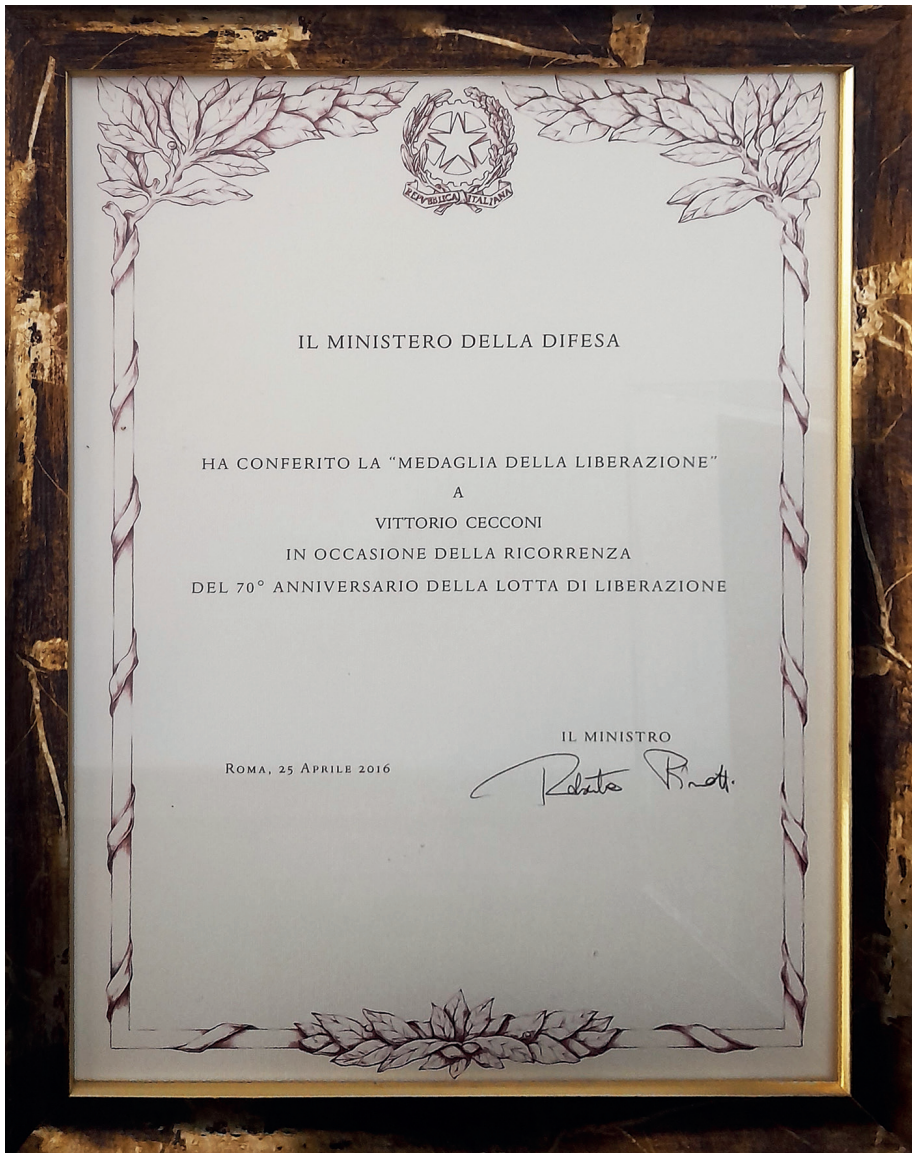
Conferimento della MEDAGLIA DELLA LIBERAZIONE