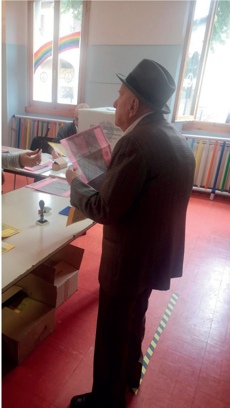
Elezioni del 25 settembre 2022