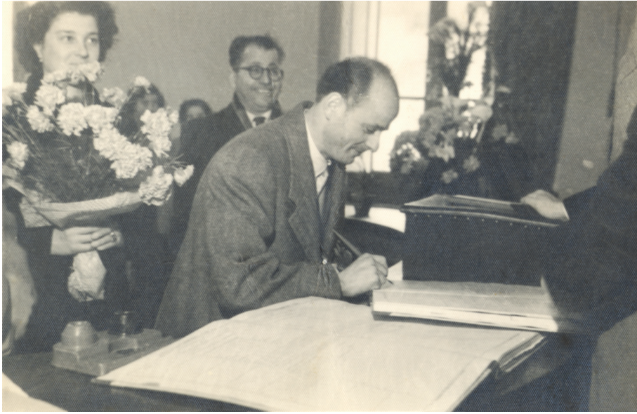
Matrimonio civile celebrato nel 1951 dal Sindaco di Reggello