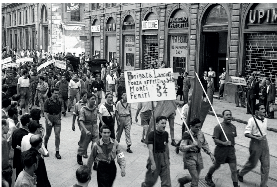
La Brigata Lanciotto nel corso dell'anniversario della Liberazione di Firenze SABATO 11 AGOSTO 1945, come risulta dall'agenda Foto Locchi – © Archivio Foto Locchi” riproduzione vietata

Chiuderà con due pezzi che finiscono per essere il suo testamento morale