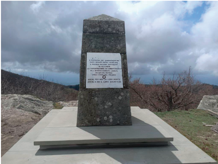
Cippo in memoria dei Caduti di Secchieta nella primavera del 1944