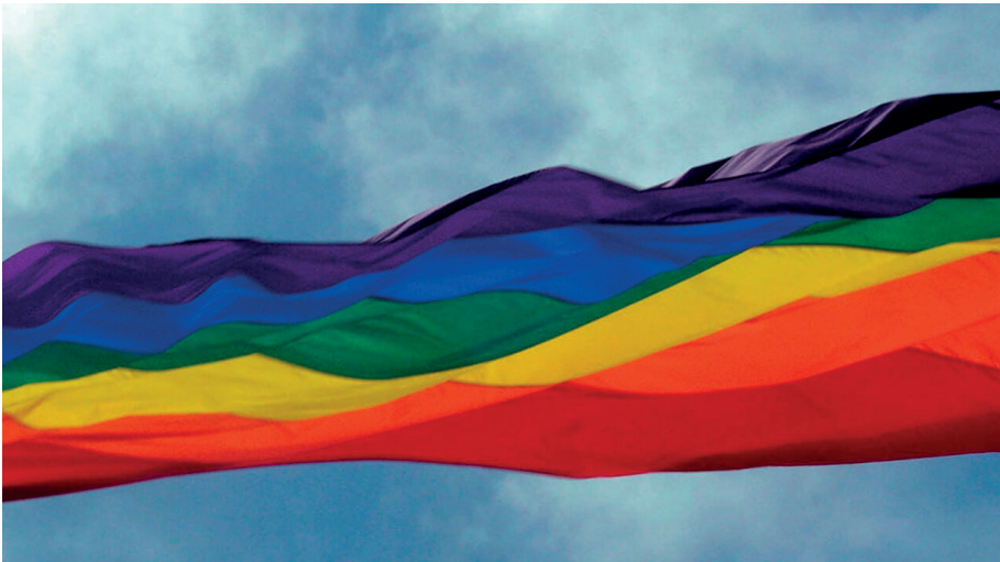
Bandiera della pace/no alla guerra

Dicembre 2022 Vittorio Cecconi/Arrivabene